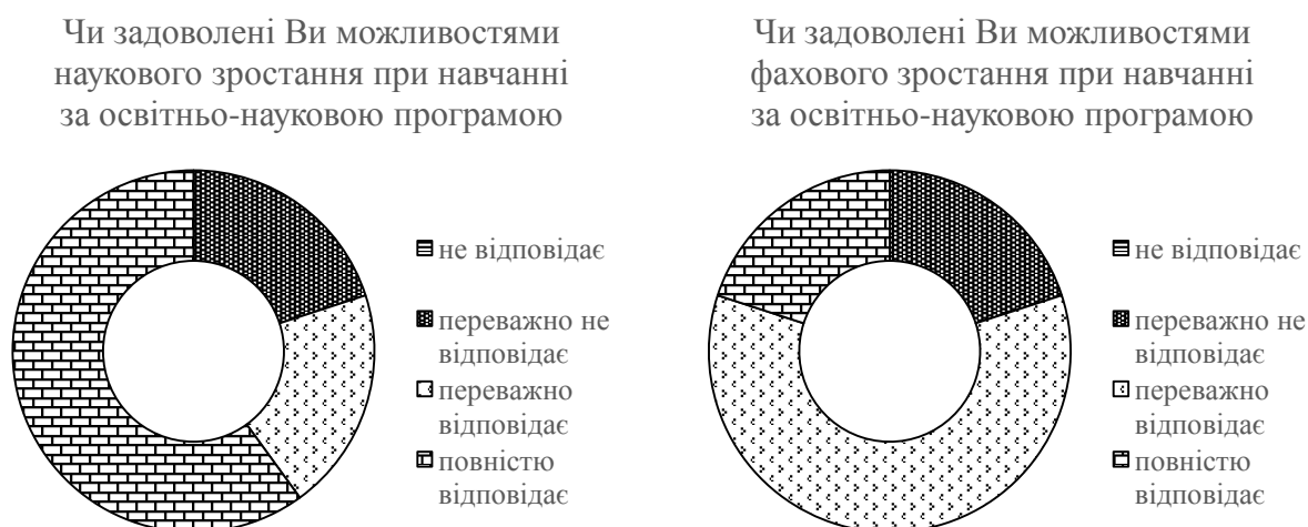
Рис. 2. Відповіді аспірантів щодо можливості наукового та фахового зростання здобувачів освітньо-наукового ступеня

Вивчення думки щодо забезпечення наукового та професійного зростання засвідчило, що 3 здобувачі високо оцінюють можливість наукового зростання в університеті та 1 фахового. В цілому освітня програма забезпечує розвиток наукових та фахових навиків 80 % аспірантів (рис. 2).