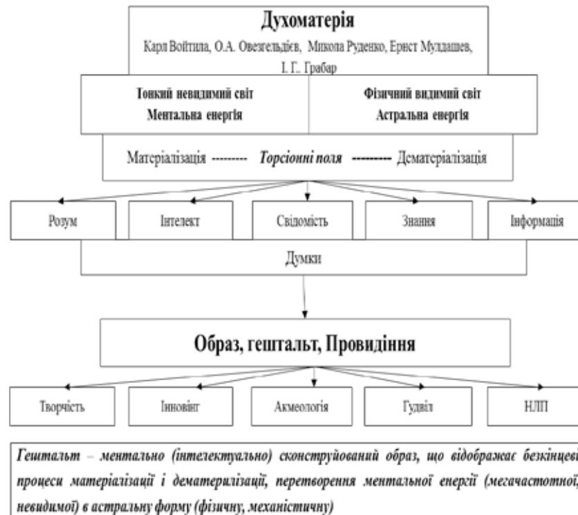
Рис. 2. Логограма формування ментального гештальту Провидіння

Суміжність може обумовлювати сприйняття, коли одна подія викликає іншу. На основі таких принципів розроблено логограму формування ментального гештальту Провидіння (рис. 2).